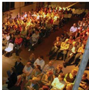
Theateropstelling 300 pers