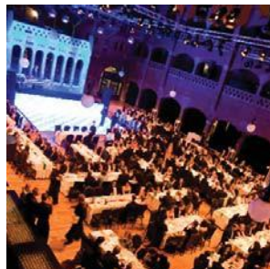
Galadiner in "domino-opstelling" Kempens & Co