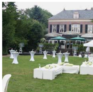
GE Access / Sun