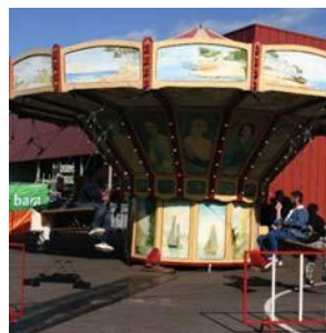
BAM Materieel Lelystad