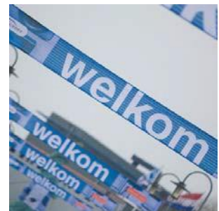
Branding bij aankomst