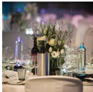
Moleculair diner aan 60 ronde tafels van 10 personen Timing