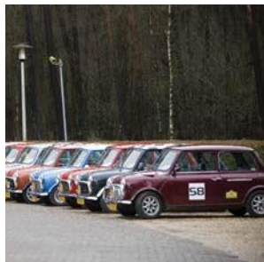
Triumph classic minirally als middagonderdeel van jubileum

Stijlvolle galafeesten met onderhoudende intermezzo's, ook zeer geschikt voor de uitreiking van prijzen of gedurende de eindejaarsperiode. Wij organiseren galadiners in verrassende locaties.