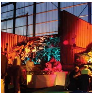
Van Helvert Metalen

Voor GE Access / SUN organiseerden wij in juni een relatie ontvangst in de tuin van een landhuis. Voor van Helvert Metalen hebben wij de "schroothopen" in de nieuwe hal gebruikt als decoratiemateriaal, dat gaf een bijzonder effect aan deze speciale avond.