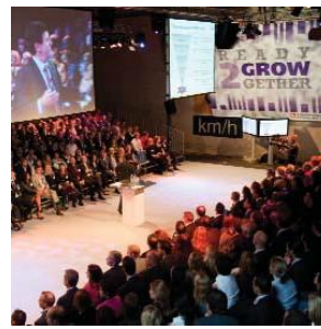
Lagerhuisopstelling 1.100 pers.